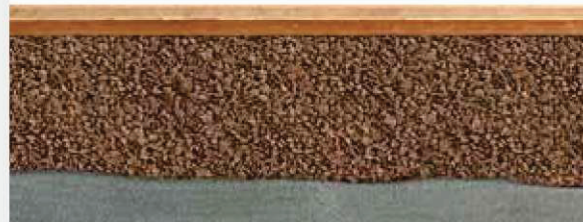
Betonový strop s dřevovláknitými deskami