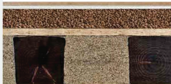
Dřevěný trámový strop