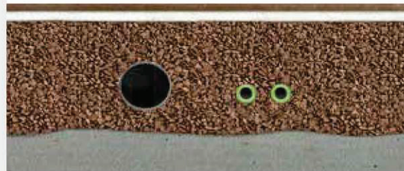
Betonový strop s cementovými deskami